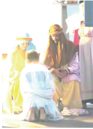
Encenação da última Ceia