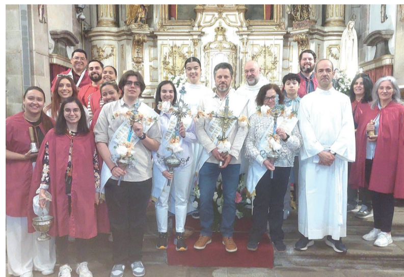
Compassos da Tarde