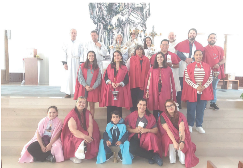
Compassos da Manhã