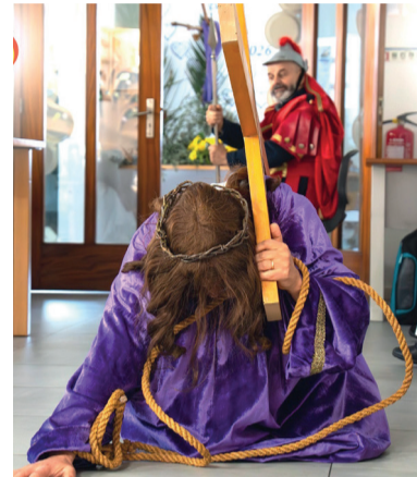
Via Sacra Centro de Dia