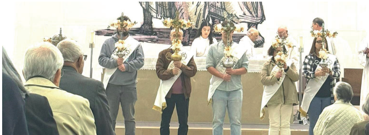
Apresentação das Cruzes