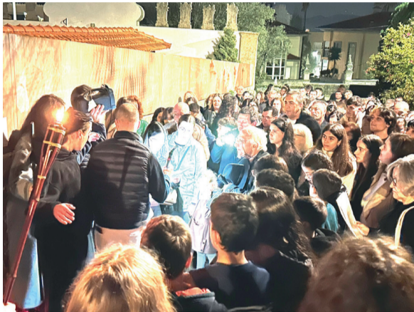
Via Sacra da Catequese