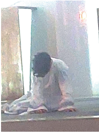
Jesus no horto