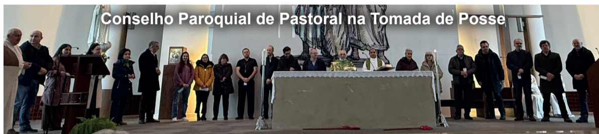
Conselho Paroquial de Pastoral na Tomada de Posse