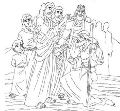
“Jesus anuncia o evangelho na Galiléia” (Mc 1,29-39)