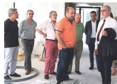
O executivo camarário através do presidente e da vereadora da acção social visitaram a obra do Refeitório Social.