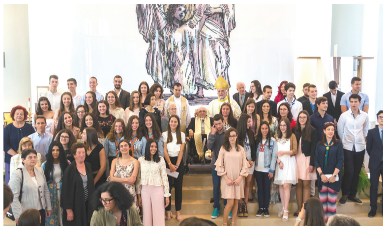
Último dia de visita Pastoral com Crisma, seguido de um almoço.