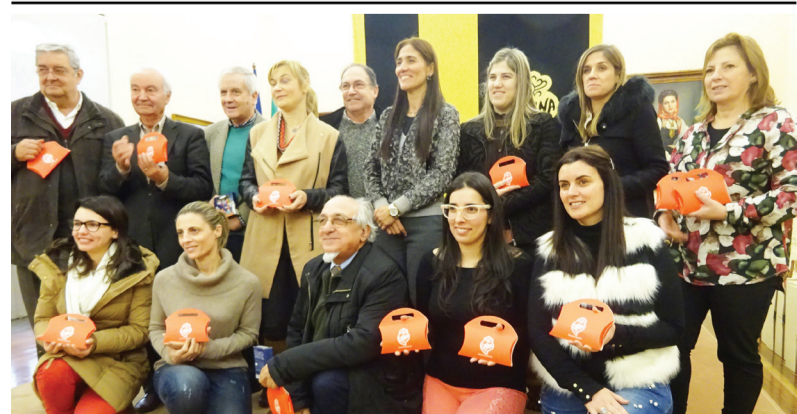
A Câmara distribuiu cabaz de Natal solidário a Instituições